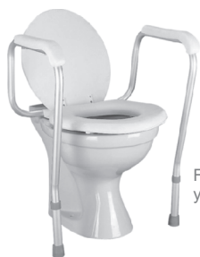
Foto del Chasis ya Instalado.