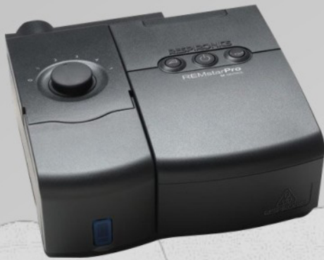
CPAP Remstar Auto Serie M Mod. LA501HS

Respironics siempre ha estado a la vanguardia en la terapia del sueño, pero el cambio radical comenzó cuando empezaba a buscar la manera de lograr que la terapia fuera más cómoda, haciendo que la administración de aire a presión fuera más agradable.