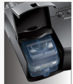
Modelo con Humidificador incluido

Adquiera los Productos de Calidad ReActiv sólo con Nuestros Distribuidores Autorizados